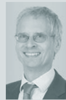
Dr. Gerhard Tretow ID-Consult GmbH