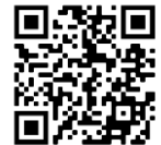
90sek-Film: Was ist METUS